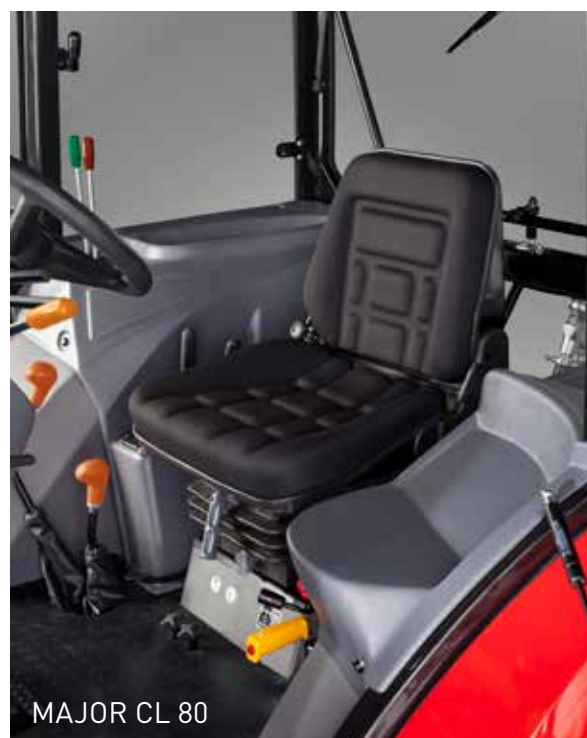
MAJOR CL 80

Kabina je konstruovaná s ohledem na praktické využití. Dostatek prostoru a ergonomicky řešené ovládací prvky usnadňují obsluhu traktoru práci. Na přání klienta je kabinu možné vybavit klimatizací a rádiem. Otevíratelné střešní okno usnadňuje dobré odvětrání kabiny a umožňuje dobrý výhled. Pro práci s čelním nakladačem je kabinu možno vybavit ochrannou střechou FOPS. Sedadla řidiče i spolujezdce jsou standardně vybaveny bezpečnostním pásem.