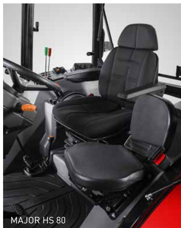
MAJOR HS 80