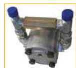
Obousměrný ventil VU pro dvojitěnné hydraulické okruhy