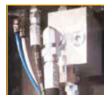
Regulační ventil VRP pro tlak a průtok oleje