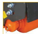
Opěrný válec většího průměru